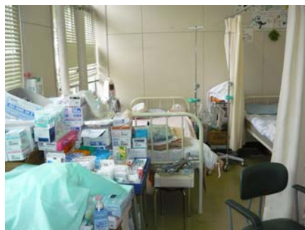
(救護所診療所内のベッドの配置)